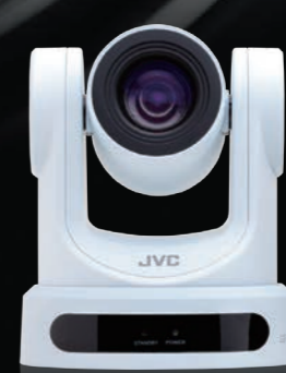
KY-PZ200N / KY-PZ200