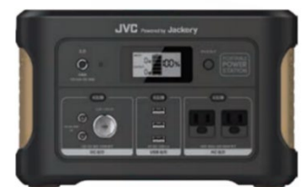
<ハンドル折りたたみ時>

・サンドベージュカラーを配色し、アウトドアや非常時をはじめ、さまざまなシーンにマッチするデザイン