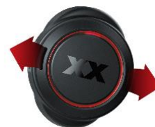
<「エクストリームディープバスポート」イメージ>

独立音響チャンバーにはトルネード状にダクトを形成したエクストリームトルネードダクトを配置。効果を高めるために回転方向の異なる2つのトルネードをシーケンシャル（連続的）に使用することで、振動板の動きを適切にコントロールし、キレのある重低音を実現。また、エクストリームディープバスポートと組み合わせることで、低音再生能力をさらに高め、深みのある重低音サウンドを実現します。